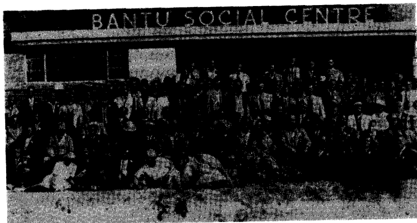
Unge medlemmer i ANC krævede en mere militant linie. I april 1944 grundlagdes ANC Youth League der på mange måde fik stor betydning for ANC's udvikling fra en moderat til en radikal nationalistisk bevægelse.

Indtil op i 40'erne var der kun lidt egentligt samarbejde mellem ANC og fagbevægelsen. De var organisatorisk, ledermæssigt og medlemsmæssigt adskilt og landarbejdernes, reservatbeboernes, industriarbejdernes, migrantarbejdernes og småborgerskabets interesser kunne ikke forenes. Strukturændringerne i perioden og Malan-regeringens undertrykkelsespolitik efter minearbejderstrejken skabte nu et interessefællesskab, der var stærkere end forskellene, og gjorde det klart, at kun en samlet indsats kunne ændre forholdene. Deltagelsen i skabelsen af AMWU i 1941 havde været ANC's første skridt i denne retning, og der var stadig svære betænkeligheder over samarbejdet med kommunisterne. Først efter 1946 begyndte en fælles