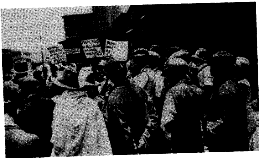
ICU gik i opløsning omkring 1930, men lave lønninger, slum og nyskabte forventninger om forbedringer førte til en bølge af militante strejker og aktioner.

I løbet af 1931 faldt den sorte fagbevægelse imidlertid stort set sammen. Dette skyldtes i høj grad den kapitalistiske verdenskrise, der ramte Sydafrika hårdt. En mere prekær årsag var den venstre-sekteriske kurs, som Sydafrikas kommunistiske parti i en kortere periode bevægede sig ind på under ledelse af blandt andre Wolton og Bach.