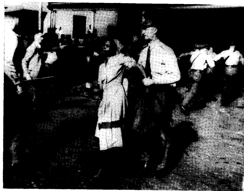
En kvinde bliver arresteret, fordi hun har sunget foran en statslig ølhal nær Durban i 1959.

Mod slutningen af 50'erne udvidede regimet principperne for bantuuddannelsen til også at omfatte de videregående uddannelser. Det ramte i særdeleshed de blandede universiteter i Witwatersrand og Cape Town og det sorte universitet Fort Hare, der skulle begrænses til kun at optage xhosa og fingo studenter. Stort set hele den