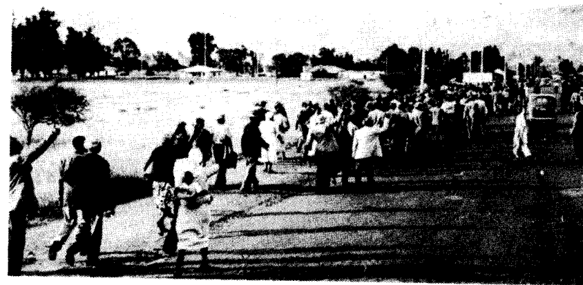
Busboykotten i Alexandria i 1957 var en af de få modstandskampe, der resulterede i indrømmelser fra myndighedernes side.

Igennem sidste halvdel af 50'erne beskyldte afrikanisterne i stadig stærkere vendinger ledelsen i ANC for ikke at levne plads til det altgennemtrængende oprør, de mente kunne komme til overfladen, hvis ANC blot gav signalet. Over for dette betonedede ledelsen og flertallet betydningen af organisation og bevidst retning. Et spontant oprør ville ikke automatisk bringe apartheid til fald.